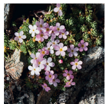
Androsace dei ghiacciai Androsace alpina