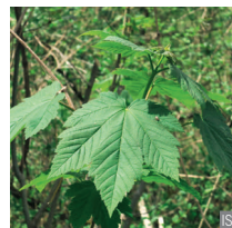
Acer di montagna Acer pseudoplatanus