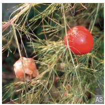
Asparago selvatico Asparagus tenuifolius