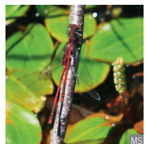
Agrion di fuoco Pyrrhosoma nymphula