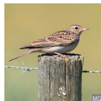
Allodola Alauda arvensis