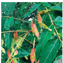
Ailanto Ailanthus altissima