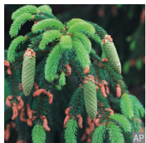
Abete rosso Picea abies