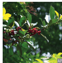
Agrifoglio Ilex aquifolium