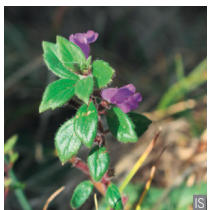
Acino alpino Acinos alpinus