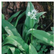
Aglione orsino Allium ursinum