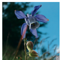
Aquilegia maggiore Aquilegia alpina