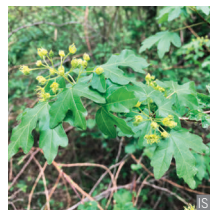
Acer oppio Acer campestre