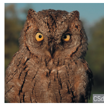
Assiolo Otus scops