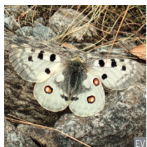
Apollo Parnassius apollo