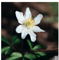
Anemone bianca Anemone nemorosa