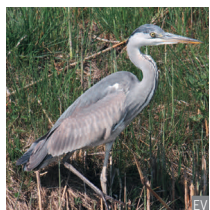
Airone cenerino Ardea cinerea