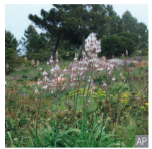
Asfodelo Asphodelus cf. albus