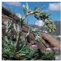
Assenzio genepi a spiga Artemisia genipi