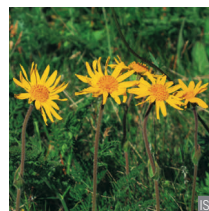
Arnica Arnica montana