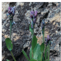
Arabetta cerulea Arabis caerulea