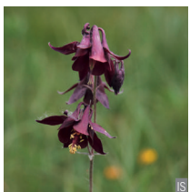
Aquilegia scura Aquilegia atrata