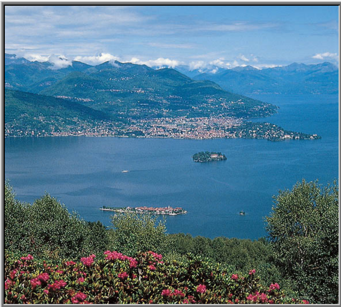
Distretto Turistico dei Laghi / Stresa / infoturismo@distrettolaghi.it